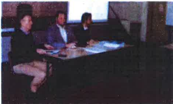
Les dirigeants du schéma de cohérence territoriale avec le maire de Monsaguel.